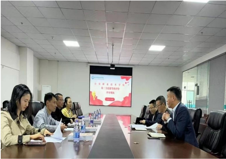
图 41 第三方技能等级评价评审现场