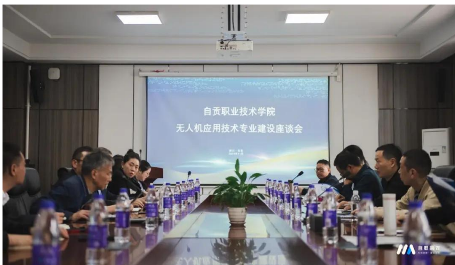
图 43 无人机应用技术专业建设座谈会

为进一步推动产教融合，培养更多符合行业需求的无人机应用技术人才，11月13日，学院联合企业共同组织召开无人机应用技术专业建设研讨会。