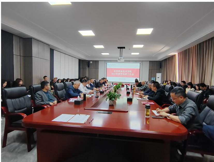
图 45 教育教学改革工作会议

余项系列改革配套文件与办法，全力保障学院教学改革的顺利推进，着力提升学院教学质量，凝练内涵特色。