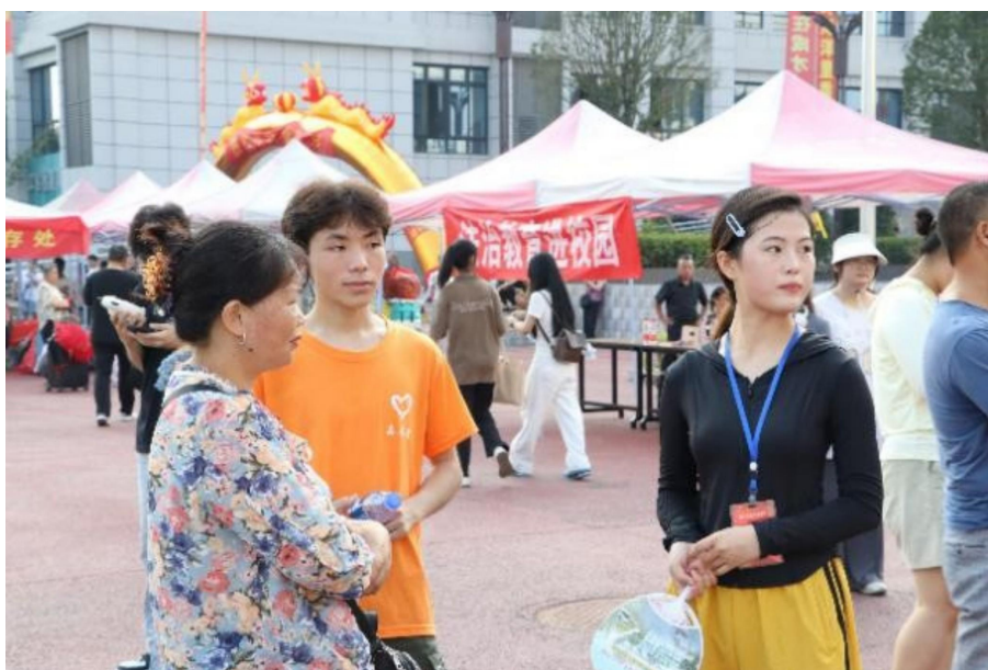
图 32 迎新志愿服务活动

学校将继续加大无偿献血工作的宣传和组织力度，鼓励更多的师生加入无偿献血的行列，用实际行动传递爱心，为构建和谐社会、保障人民健康作出更大的贡献！