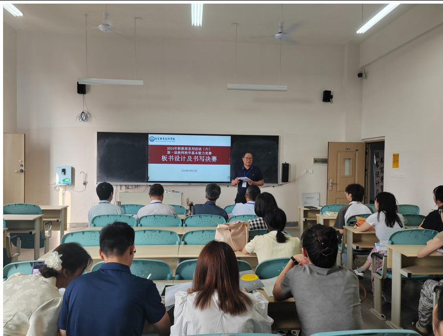
图 46 第一届教师教学基本能力竞赛——板书设计及书写决赛

在比赛过程中，参赛选手坚持以立德树人为宗旨，以学生为中心，结合学情、找准落脚点，积极开展教育教学改革和实践。通过“以赛促建”，发挥教学比赛在提高教师队伍建设中的示范作用，促进教师在专业技能、课堂教学质量等方面的成长。