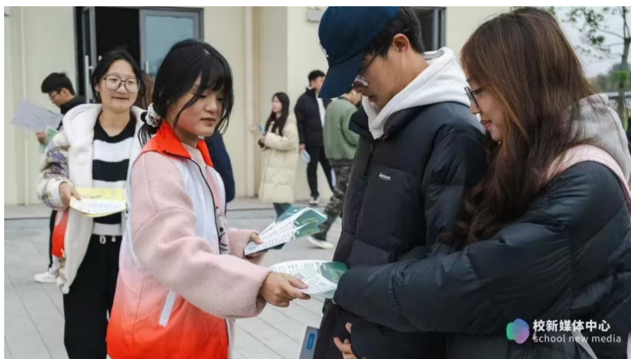
图 19 “共创无烟校园，共享清新校园” 宣传活动

舒适的学习生活环境，培养学生的环保意识和社会责任感。本年度，学院积极响应国家生态文明建设号召，将绿色理念贯穿于校园规划与管理的全过程。通过实施“无废校园”“无烟校园”建设、学生“四自教育”等措施，有效提升了校园的环境质量。同时，学院还注重安全教育与管理，通过举办安全知识讲座、安全应急演练等活动，增强师生的安全意识和自我保护能力，共同构建了一个绿色、平安的校园环境。