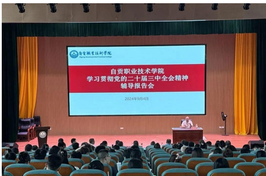
图 3 学习贯彻党的二十届三中全会精神专题辅导报告会

思政建设和“三进”工作。通过召开大学生思想政治工作会议、全面从严治党工作会议、师德师风专题培训会，不断推进我校“三全育人”工作，进一步加强全校师生的思想政治教育。三是强化信息审查。制定了《自贡职业技术学院重大决策网络舆情风险评估审查办法（试行）》《自贡职业技术学院网络舆情处置管理办法（试行）》《自贡职业技术学院新闻发布与新闻宣传工作管理办法（试行）》等宣传管理制度，严格落实信息审查机制。