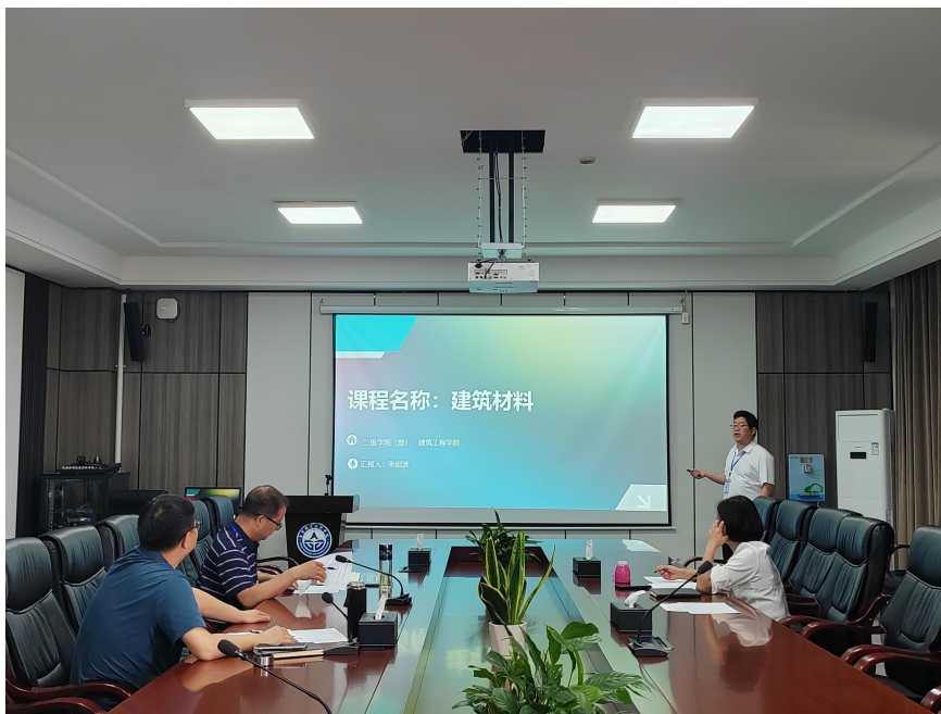
图 49 第一届教师教学基本能力竞赛——说课决赛