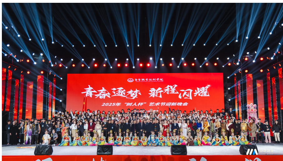
图 20 “树人杯”艺术节迎新晚会