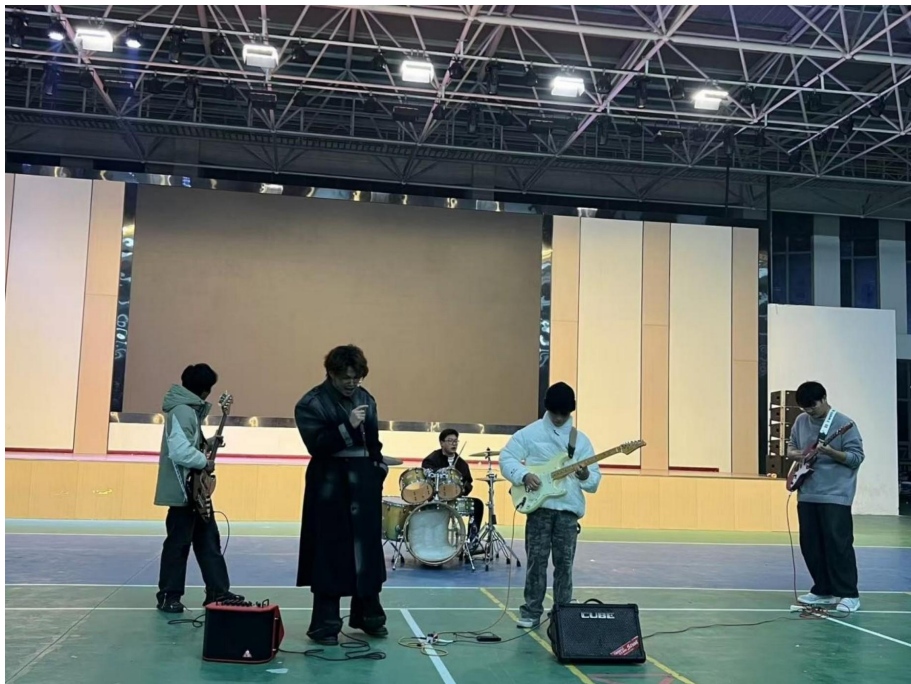
图 23 社团活动——音乐社团