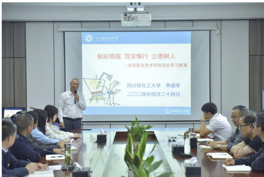
图 1 党纪学习教育专题辅导