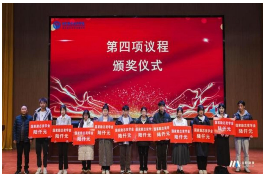
图 36 学院举行国家奖学金、国家励志奖学金发放仪式

认定家庭经济困难学生 2145 人，发放国家助学金共计 396.825 万元。完善了国家奖学金、国家励志奖学金资助政策体系，2023-2024 学年度评定国家奖学金 11 人，发放资金共计 11 万元，国家励志奖学金 150 人，发放资金共计 90 万元，评定 2024 年国家筑梦奖学金 4 人，发放资金共 1.6 万元，帮助家庭经济困难学生顺利完成学业。二是加强资助政策宣传。组织开展资助政策宣讲会，为学生详细解读了资助政策的申请条件、评审程序、发放标准等内容。同时还通过学校网站、微信公众号、宣传栏等多种渠道，广泛宣传国家和学校的资助政策，提高学生对资助政策的知晓度。三是强化资助育人功能。开展“诚信教育月”活动，通过主题班会、征文比赛、演讲比赛等形式，加强对学生的诚信教育，培养学生的诚信意识。组织受助学生参加志愿服务、社会实践等活动，引导学生感恩回馈社会，培养学生的社会责任感。