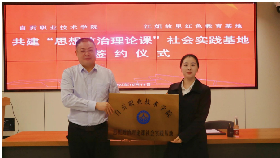
图 9 学院与江姐故里携手共建思想政治理论课社会实践基地

实践教学内容，提升思政教育的针对性和实效性，让思想政治理论课堂更加生动、更加有趣、富有感染力，努力培养更多具有坚定理想信念和深厚爱国情怀的新时代青年人才，为实现中华民族伟大复兴的中国梦贡献力量。