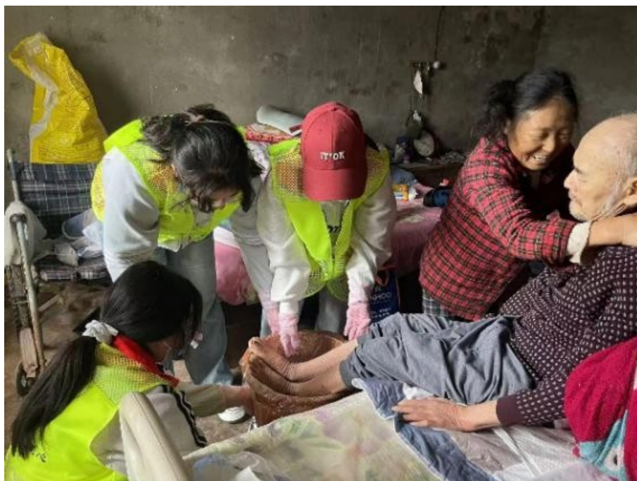
图 29 社区志愿服务活动