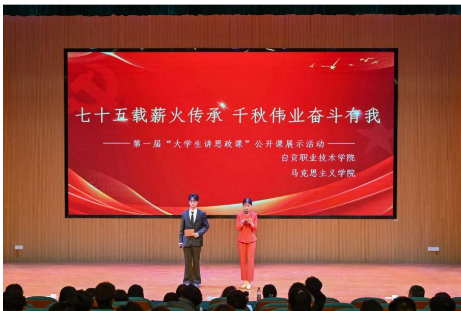
图 16 “大学生讲思政课”公开课展示活动

政课的理论知识与实践紧密结合，充分展现了青年对思政课内容的深刻理解和见解，体现了积极向上的精神风貌和社会责任感。同时，此次活动不仅是一次思政课学习成果的展示，更是一次思想的启迪和精神的塑造。