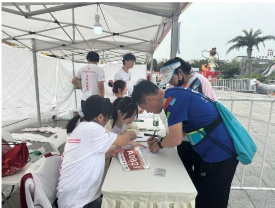
图 33 自贡市马拉松志愿服务活动