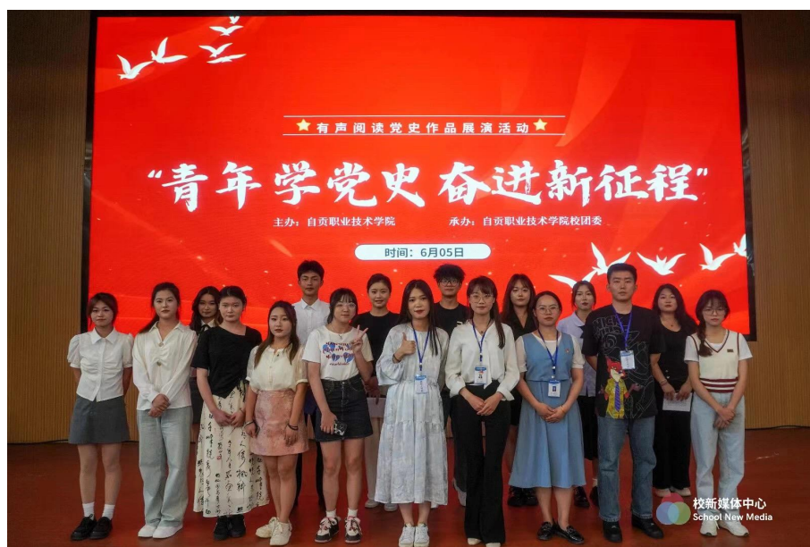
图 12 大学生有声阅读党史作品活动

红色党建文化是学院文化的重要组成部分，它不仅是党的优良传统和革命精神的传承，更是激发师生爱国情怀、增强校园凝聚力的源泉。本年度，学院深化红色党建文化建设，通过举办“青年学党史，奋进新征程—大学生有声阅读党史作品活动”等活动，让师生在参与中感受红色文化的魅力，增强对党的认同感和归属感。同时，学院还注重将红色党建文化融入日常教育教学，通过举办“大学生讲思政课公开课”、组织“红色主题党日活动”等形式，让红色基因在校园内代代相传，营造出充满活力与阳光的校园文化氛围。