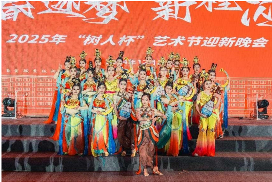
图 22 社团活动——流行舞社