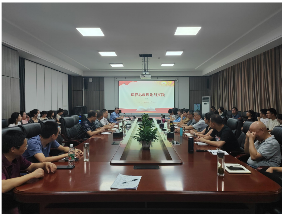
图 42 课程思政理论与实践专题讲座