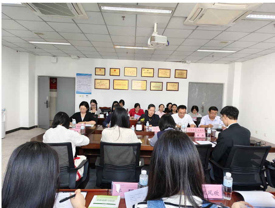
图 11 思政教师集体备课活动

此次集体备课活动对提升高校思政课教学质量具有积极的推动作用，促进了两校马院教师对思政课教学的理解和把握。两校马院后续会持续开展组织交流活动，助推学院内涵建设迈上新台阶。