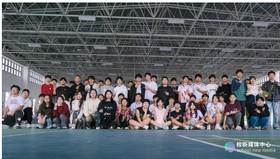
图 25 社团活动——羽毛球社团