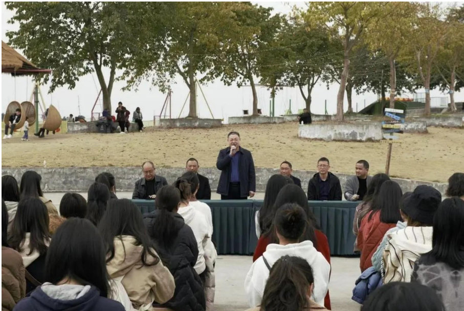
图 4 “3.8”国际妇女节踏春活动

2024 年深度推进党员联系基层、联系师生，密切师生关系、党群关系、干群关系，推动全体党员积极作为、勇于担当，切实将联系工作落到实处，解决实际需求，确保学校各项中心工作高效推进。一是加强工会工作，高效推进会员认证。采用线上线下相结合的方式，广泛宣传动员，安排专人负责，确保工会会员身份认证工作快速、准确完成，为后续工会活动开展奠定基础。积极开展“3.8”国际妇女节踏春活动，庆“五一”活动，端午节送粽子活动，教师节、中秋节、国庆节三节慰问活动，教职工趣味运动会等，提升全体教职工凝聚力与归属感。