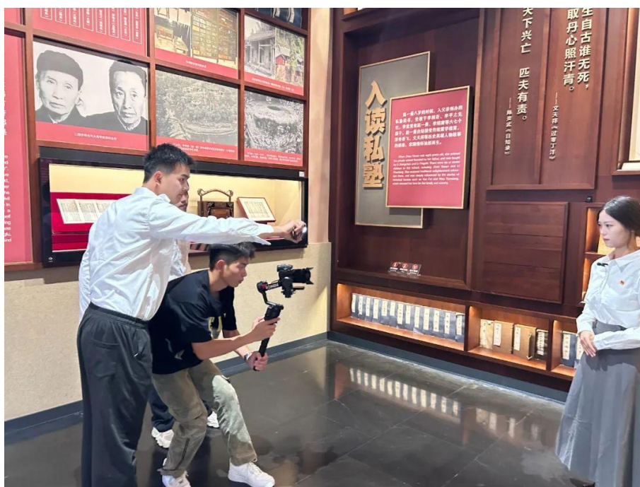
图 15 各小组前往校外红色基地展开实践拍摄

10月11日晚，学院在会议中心3楼报告厅举行了“大学生讲思政课”公开课展示活动。学生通过生动的语言、鲜活的事例、真挚的情感，将思