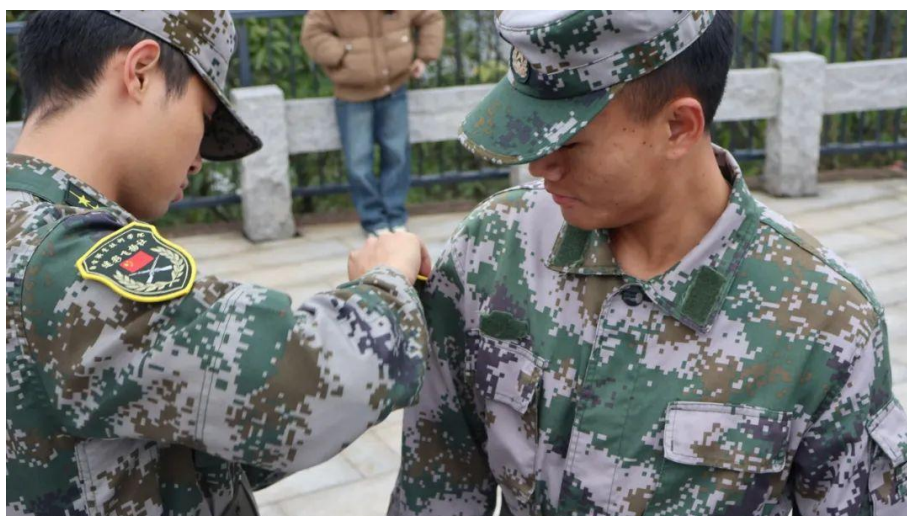
图 27 授衔仪式

此次活动不仅增强了学生们的体魄，更加坚定了他们为实现自身价值而不懈努力的信心。参与同学纷纷表示，这段不可多得的经验将成为他们青春记忆中最珍贵的一部分。他们在拉练中所展现出的团结互助精神、在授衔仪式上立下的铮铮誓言，将化作源源不绝的动力，激励他们为梦想不断拼搏。