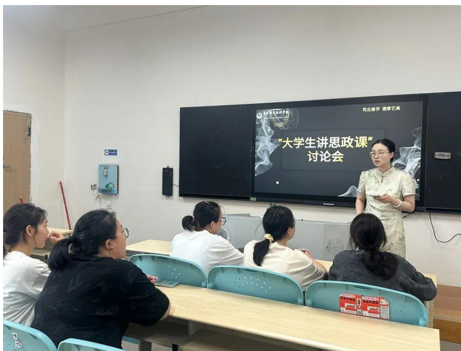
图 14 师生共同研讨