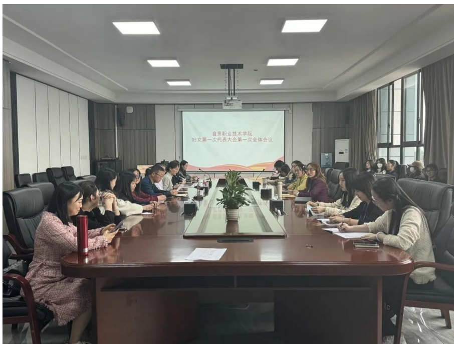
图 6 妇女第一次代表大会

三是加强妇女儿童工作。为充分发挥妇女组织的半边天作用，3月召开妇女代表大会，选举成立自贡职业技术学院妇女联合会，9月成立了关心下一代工作委员会，为后期积极开展各类活动，关心关爱妇女儿童生活，维护妇女儿童合法权益打下坚实基础。