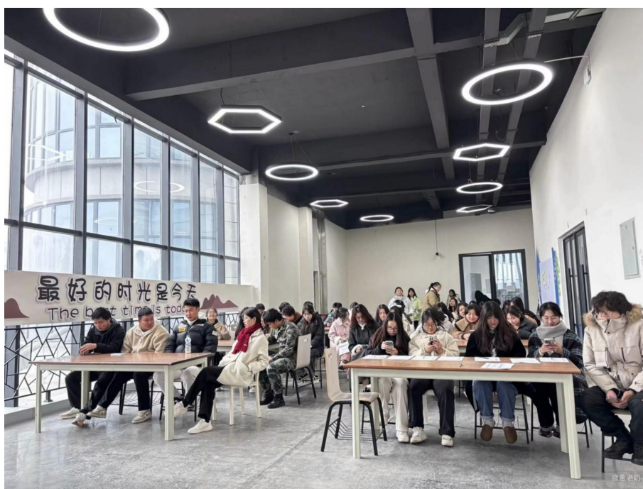
图 18 “诗韵悠扬，墨香沁心” 诗歌分享会