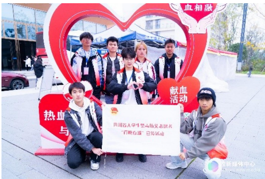
图 34 四川省大学生禁毒防艾志愿者“百校百场”宣传活动