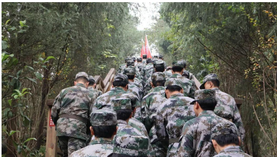
图 26 迷彩飞扬社拉练

此次拉练全程 23 公里，是对他们体能与毅力的严峻考验，更是对心灵的一次洗礼。这不仅是一次体能的挑战，更是一次思想的磨砺。走过的每一段路，都是对革命先辈艰苦奋斗精神的重温。许多同学在途中表示：“通过这样的活动，深刻体会到了革命先烈为我们今天的幸福生活所付出的牺牲与努力，增强了自身责任感与集体荣誉感。”