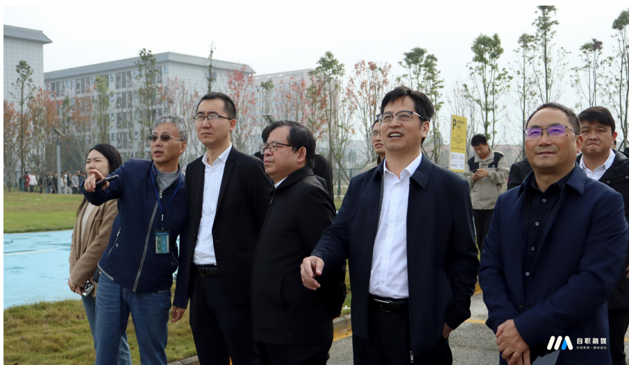
图 44 与会领导参观无人机飞行实训机场

我校将与企业携手并进，共创辉煌，通过产教融合、创新驱动，塑造校企合作的新典范。重点从突出特色、文化交融，共同绘制校企合作的新图景，为社会培养更多优秀的无人机专业人才，更好地服务地方经济发展。