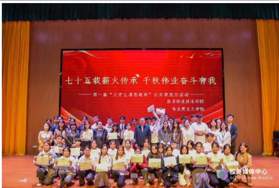
图 13 第一届“大学生讲思政课公开课”展示活动