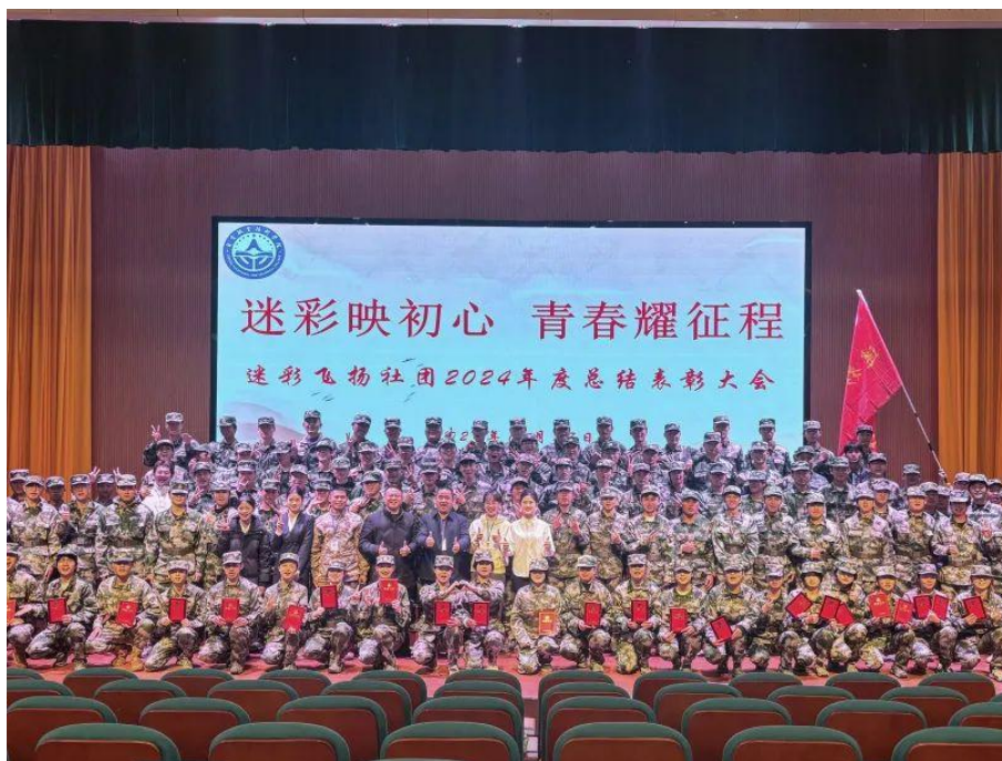
图 28 迷彩飞扬社团 2024 年度总结表彰大会