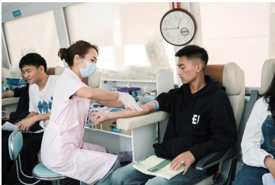
图 31 无偿献血活动现场

学校将继续加大无偿献血工作的宣传和组织力度，鼓励更多的师生加入无偿献血的行列，用实际行动传递爱心，为构建和谐社会、保障人民健康作出更大的贡献！