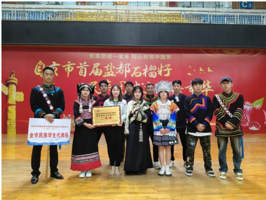
图 7 盐都石榴籽民族团结运动嘉年华

未来，我校将继续组织各类体育运动和民族活动，深化民族团结进步教育，让各民族像石榴籽一样紧紧拥抱着在一起，为盐都的繁荣与发展贡献力量。