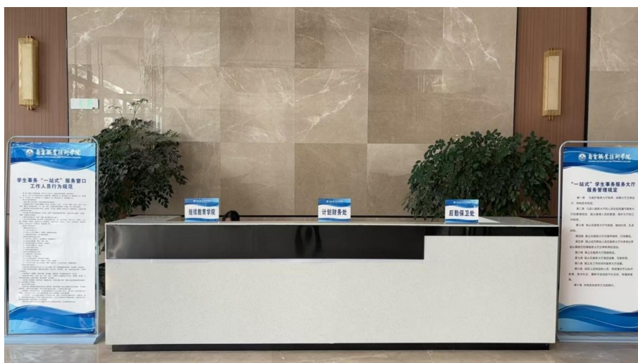
图 35 “一站式”学生社区大厅

学生社区大厅，五个“一站式”分社区，内设心理咨询室、党建活动室、师生交流室。“一站式”学生社区大厅共有6个窗口：一是团学管理，面向学生提供团学活动审批，参军政审，档案查询，助学贷款受理等服务。二是教务学籍，面向学生提供办理学生证、学籍证明，休学/复学/退学，毕业证发放等服务。三是财务缴费，面向学生提供费用缴纳、费用清算、缴费查询等服务。四是后勤服务，面向学生提供“一卡通”、网络、水控电控问题处理，报修等服务。五是招生就业，岗位实习手续办理服务。六是继续教育，提供学历提升、培训考证、驾校咨询等服务。