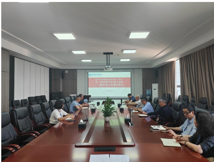
图 48 第一届教师教学基本能力竞赛——教学设计决赛

以赛促研，以研促教；改革创新，内涵发展。下一步，学校将紧紧围绕立德树人根本任务，持续搭建平台引领教师专业成长，提升教师综合素养，进一步加强教师队伍建设，促进学校内涵发展。