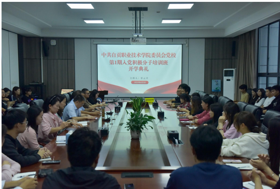
图 8 第一期入党积极分子培训班开班典礼

集中培训 8 次，学员集中自学 4 次，开展红色教育基地现场教学 2 次，专题讨论 2 次，撰写心得 62 篇，组织集中结业考试 1 次。