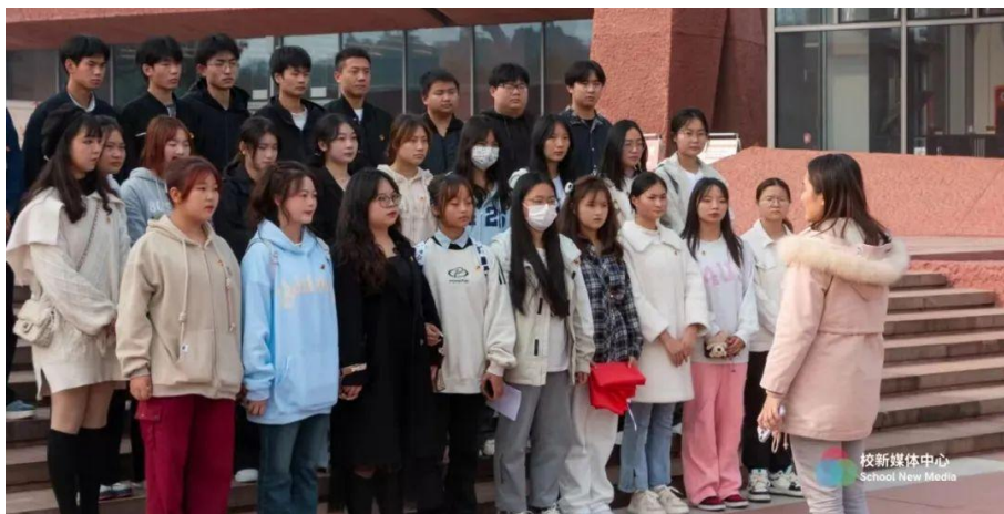
图 5 组织学生前往江姐故里红色教育基地开展爱国主义教育

此次主题团日活动的开展，不仅让团员青年们接受了一次深刻的红色文化洗礼，更激励团员青年们不忘初心使命，传承红色基因，坚定理想信念，锤炼高尚品德，矢志实学实干，为实现中华民族伟大复兴的中国梦而不懈努力。