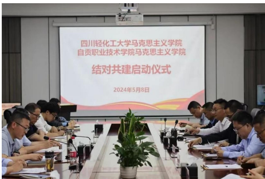
图 10 结对共建启动仪式

此次结对共建对加强我校学院马克思主义学院建设具有十分重要的意义，是推动学校大学生思政课教师队伍建设、课程建设和提高学校教育教学质量的重要举措。同时就进一步做好两校结对共建工作提出五点意见：一是精心谋划布局，细化共建方案；二是积极学习借鉴，汲取先进经验；三是强化培训交流，锻造卓越团队；四是资源整合共享，丰富教学内容；五是加强总结宣传，展示共建成果。