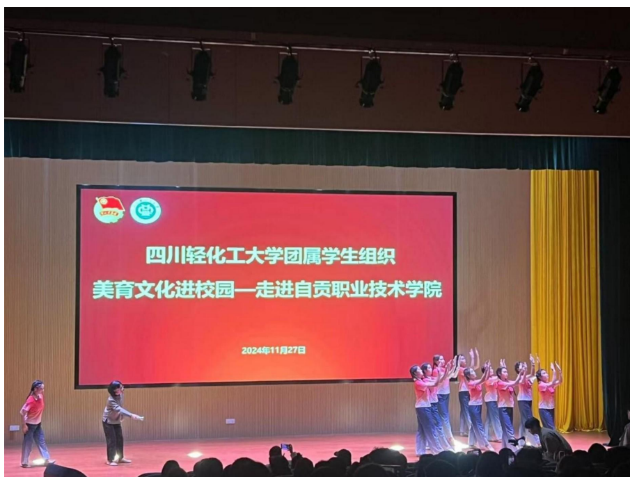
图 24 社团活动——美育文化进校园