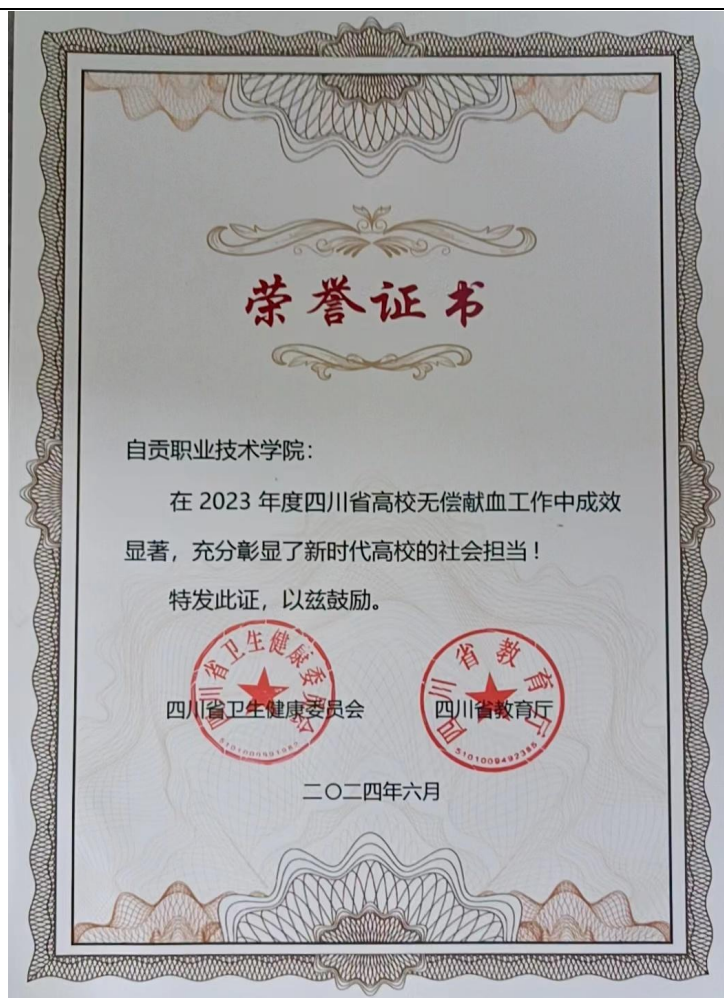
图 30 无偿献血荣誉证书

在献血活动现场，师生们排起了长队，纷纷献出自己的爱心。他们中既有多次献血的“老兵”，也有初次奉献爱心的“新手”，他们都怀着一颗炽热的心，希望为需要帮助的人贡献自己的一份力量。据统计，2023 年度我校累计参与无偿献血的师生人数达到了 567 人次，献血总量超过了 838U，为缓解当地临床用血紧张局面做出了重要贡献。