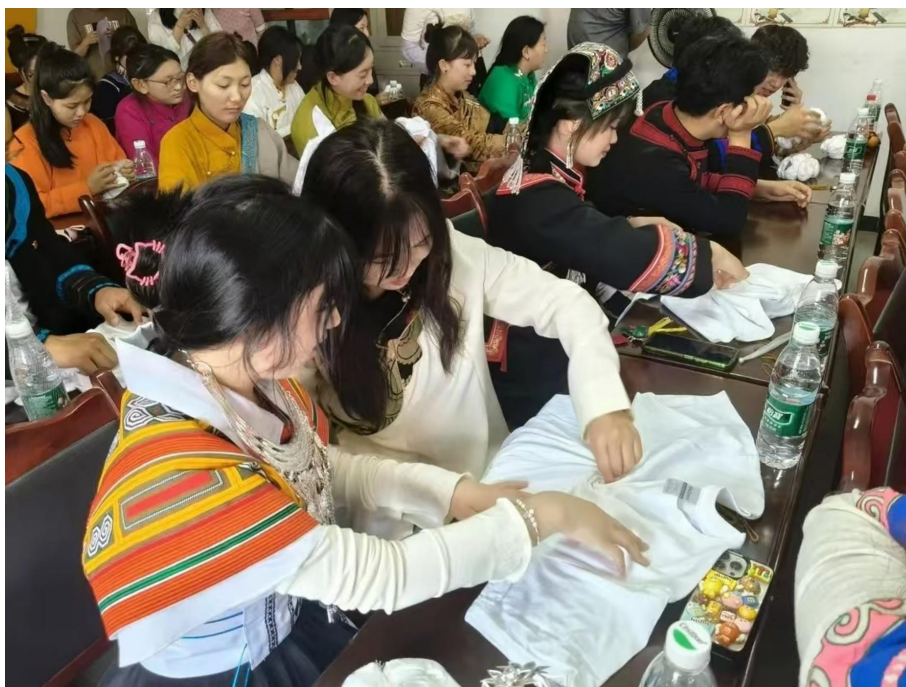
图 17 自贡市非遗文化体验活动