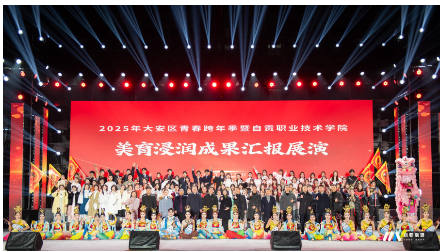
图 21 美育浸润成果汇报展演晚会