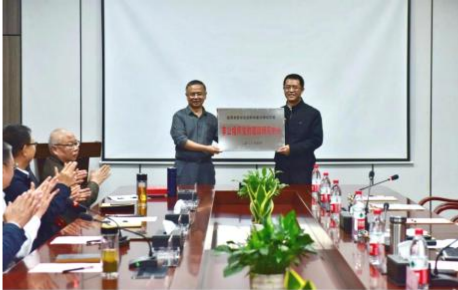
图 2 非公组织党的建设研究中心授牌仪式